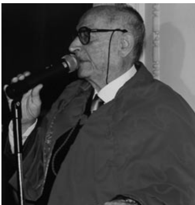
Professor Emérito, FDR-UFPE, 1999.