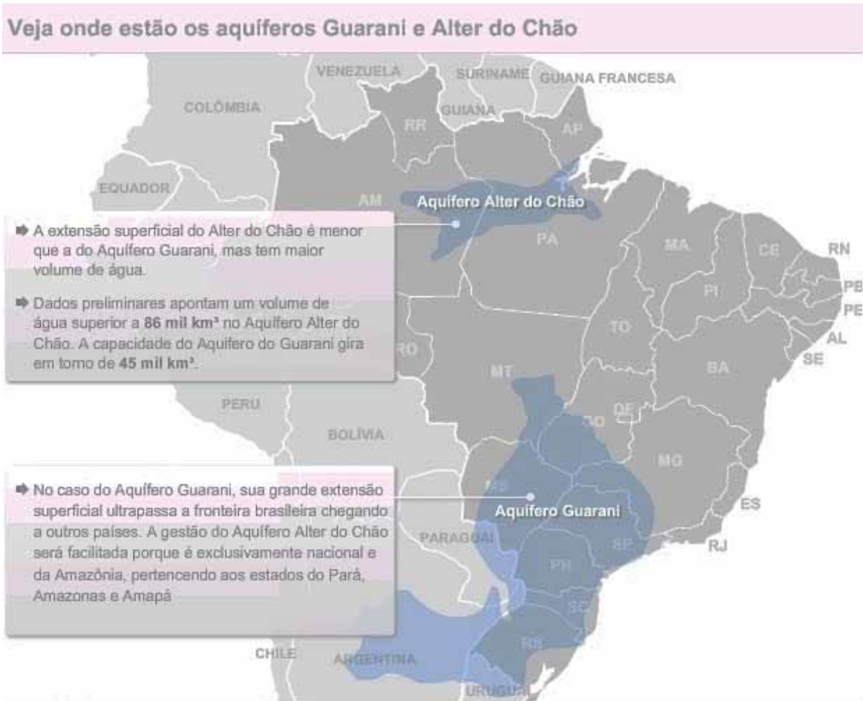
Gráfico 4: Aquíferos no Brasil