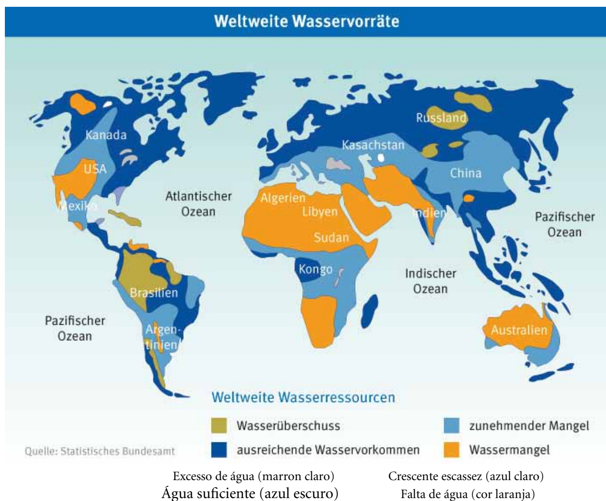
Figura 3: Reservas de água no mundo inteiro